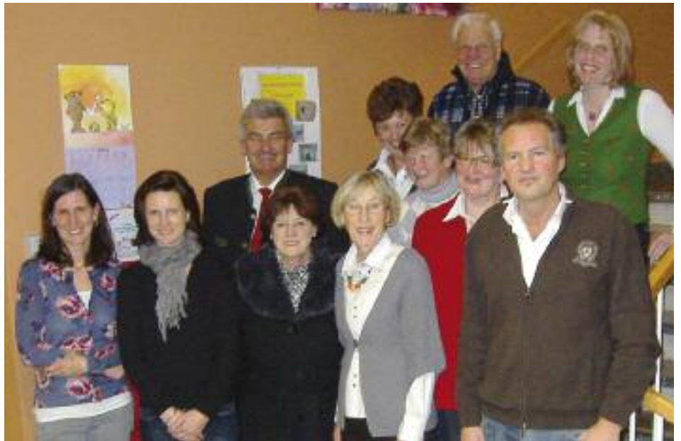
Im Bild der neue und alte Vorstand mit Bgm. Simon Illmer.

Die positive Zusammenarbeit mit dem Musikum Pongau soll auch in diesem Jahr in Form eines Konzertes von Nachwuchsmusikern im Gemeindefestsaal erhalten bleiben ("Vivat musikum!"). Natürlich sind auch im Freilicht-erlebnis 7 Mühlen einige besondere Attraktionen geplant. So wird der beliebte Wasserspielplatz neu angelegt und erweitert. Auch eine Sonderausstellung in der Eingangsmühle ist in Vorbereitung. Die Teilnahmen an der Pongauer Museumsnacht, am Salzburger Museumstag und bei der "Langen Nacht der Museen" sind ebenfalls geplant.