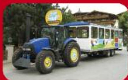
Der GEISTERBERGZUG vom St. Johanner Geisterberg!