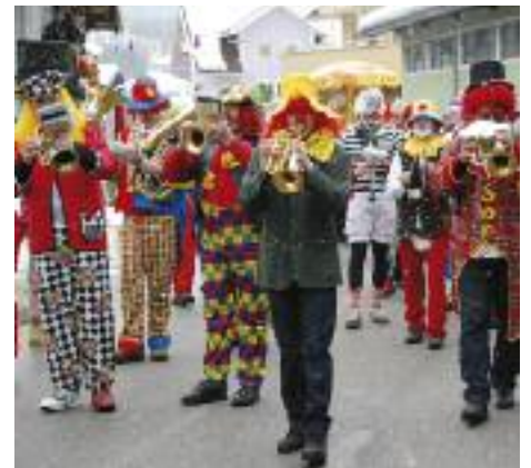
Die Trachtenmusikkapelle Pfarrwerfen