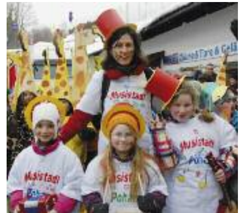
Der Musistadt Pöham