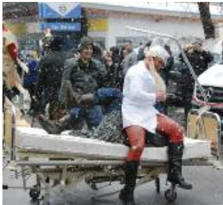
Das mobile Altenheim