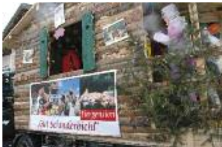
Tierpension „Gut Schinderbichl“