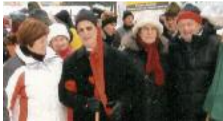
Im Bild die Präeisschützen in Bischofshofen.