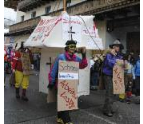
In memoriam Zehenthoflift

Esel", "Fischerwirt-Express", "Tierpension Gut Schinderbichl", "EU-Zirkus" uvm. zu bewundern und bei dem einen oder anderen Wagen einzukehren. Besonders gelungen die Interpretation von Landtagspräsident Simon Illmer, Bürgermeister von Pfarrwerfen - oder wie man auf gut pongauerisch sagt: "Buagamoasta von da Pfo". Alle Akteure führten dem staunenden und großteils auch faschingsmäßig verkleideten Publikum immer wieder lustige Darbietungen vor. Die verschiedenen Musikgruppen taten mit schwungvoller Musik ihr Übriges zur Stimmung, die besser nicht hätte sein können. Nachdem der Faschingsumzug um 13 Uhr seinen Ausgang beim Sägewerk Rettensteiner genommen hatte, erreichte man das Ziel - den Dorfplatz - um etwa 16 Uhr, wo dann die Veranstaltung ihren gemütlichen Ausklang fand. Das Resümee von Rudolf Vierthaler, Hauptmann der Peter-Sieberer-Schützen (bei dem Faschings-Spektakel als Michael Aufhauser zugange): "Es war ein großartiges Miteinander der Dorfgemeinschaft, der Teilnehmer und Besucher aus den umliegenden Gemeinden. Mir ist ein großer Stein vom Herzen gefallen, dass alles so gut gelaufen ist und keine Unfälle passiert sind."