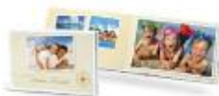
Fotobuch-Design - Symbolfotos