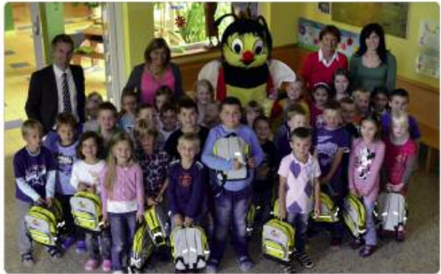
Stellvertretend für insgesamt 8 Klassen. Hier die 1. Klasse der VS Pfarrwerfen.

Als kleine Überraschung für die Kinder sind im Rucksack Schultensilien wie z.B. Lineal, Radiergummi, Buntstifte usw. eingepackt. Um die nötige Sicherheit im Straßenverkehr zu gewährleisten, wurden die Rucksäcke mit Sicherheitsreflektoren ausgestattet.