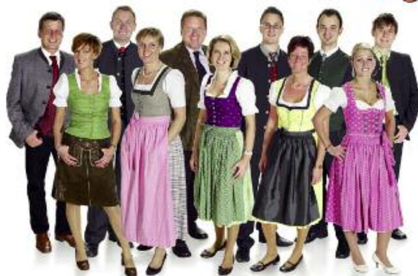
Das Schafterteam der Raiffeisenbank Bischofshofen freut sich auf Ihren Besuch!