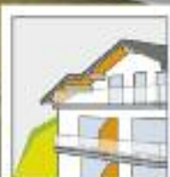
WOHNANLAGE FAMILIENIDYLLE HOF WAGRAIN