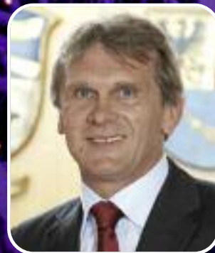
Vizebgm. Werner Schnell Bischofshofen