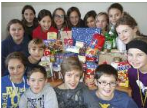
Die Klasse 1C mit den gesammelten Artikeln.

diese Einnahmen kommen in einen Notfallfond für schulinterne Härtefälle.