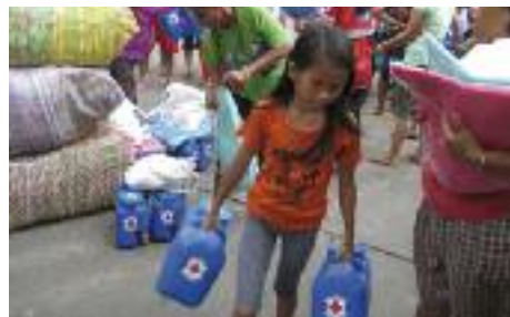
Im Bild Nahrungsmittel und Hilfsgüter für die Taifun Opfer.

verheerenden Auswirkungen des Taifuns Haiyan vergangenen November auf den Philippinen haben sich die Aktivgruppen aus den unterschiedlichen Gemeinden des Salzburger Landes kurzerhand entschlossen, einen Beitrag für das Hilfsprojekt des Roten Kreuzes Salzburg zu leisten.