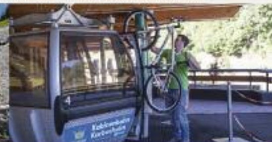
GRATIS BIKE TRANSPORT