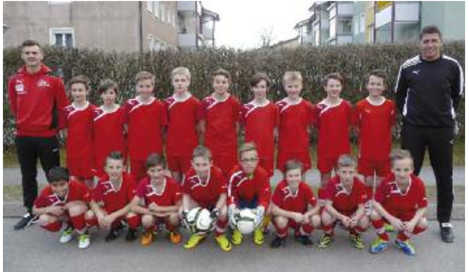
Im Bild die Mannschaft der LAZ Vorstufe Pfarrwerfen (Jahrgang 2003).

Pfarrwerfen/Kuchl - Einen großen Erfolg beim international besetzten Göll-Cup in Kuchl feierte die LAZ Vorstufe Pfarrwerfen. Unter den 16 teilnehmenden Mannschaften erreichte Pfarrwerfen den hervorragenden zweiten Platz. Nach drei souverän gewonnenen Vorrundenspielen konnten im oberen PlayOff zwei Siege und ein 1:1 gegen die Mannschaft von Red Bull Salzburg erzielt werden. Im Halbfinale schlugen die Jungs der LAZ Vorstufe Pfarrwerfen die Mannschaft von Wacker Innsbruck mit 2:0. Im Finale gab es erneut ein Aufeinandertreffen mit der Mannschaft von Red Bull Salzburg. Nach einem torlosen Remis unterlag man den Bullen im Siebenmeter Schießen sehr unglücklich mit 4:3. Sehr beachtlich war, dass Pfarrwerfen in den acht Spielen bei diesem Turnier insgesamt nur zwei Gegentore erhalten hat.