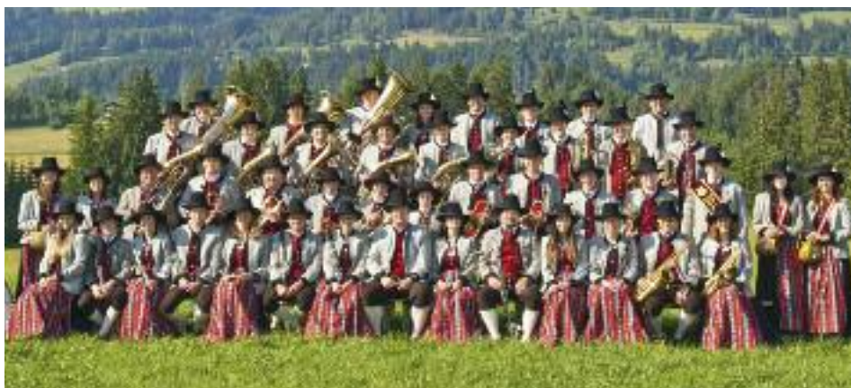
Im Bild die TMK Pfarrwerfen mit der neuen Tracht.

Die Festgemeinschaft lädt recht herzlich zum Besuch der Jubiläumsfestwoche in Pfarrwerfen ein.