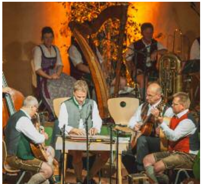
Höllbergmusi, Amsel Singen 2016