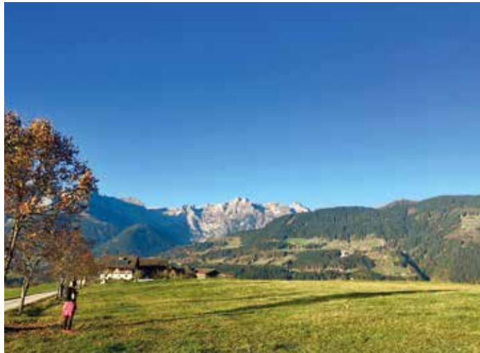
Wunderschöner Ausblick vom Buchberg/Platten in Richtung Eiskögerl.

Die Gaisbergloipe wird im Winter 2018/2019 eine ca. 500-700 m lange Schleife erhalten, die mit Kunstschnee präpariert wird, um eine längere Nutzung zu ermöglichen. Zugleich hoffen wir, der Bevölkerung damit eine naheliegende gute Alternative zu bieten, zwischendurch oder auch abends im Flutlicht