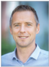
AK-PRÄSIDENT PETER EDER

Die Teuerung klettert Monat für Monat scheinbar unaufhaltsam nach oben. Sie bewirkt, dass die Menschen bis Jahresende mehr als 1400 Euro an Mehrkosten stemmen werden müssen. Diese zusätzlichen Belastungen machen sich auch in der AK-Beratung bemerkbar. Immer häufiger kommen verzweifelte Menschen zu uns, die nicht mehr wissen, wie sie über die Runden kommen sollen.