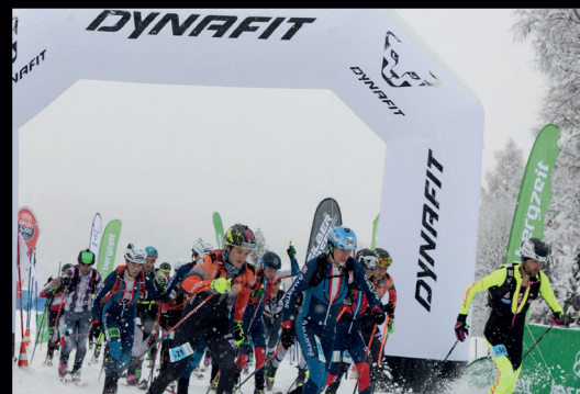
Großartige Leistungen der Skibergersteiger bei der Erztrophy Ende Jänner.