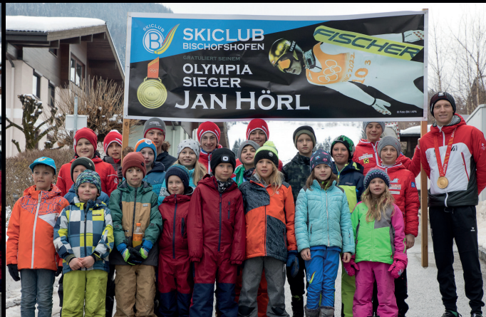
Die Kinder des Skiclub Bischofshofen begrüßten unseren Olympiasieger.